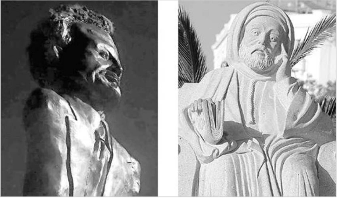
تمثال ابن باديس وابن مهدي