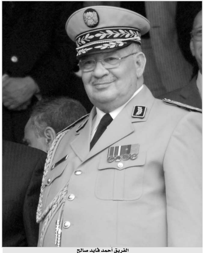
الفريق أحمد هايد صالح

والفريق قائد صالح في كلمة له بمناسبة افتتاح أشغال الندوة التاريخية "انتصارات إستراتيجية لثورة نوفمبر 1954"، عن قيم الثورة التحريرية المجيدة ومبادئها السامية، وقال "إنها ينبغي أن تفرس في النفوس وترسخ في العقول لتكون بذلك، الضمانة الأكيدة لحاضر بلادنا ومستقبلها، وتلكم مسؤولية ثقيلة يتعين على