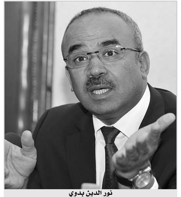
نور الدين بدوي

نفسى وزير الداخلية والجماعات المحلية نور الدين بدوي أن تكون الجزائر تعاني من إشكالية أمنية أو سيطرة على الوضع بسبب الأفارقة المنتشرين عبر التراب الوطني، مؤكدا رفض السلطات الجزائرية فكرة التشكيك في تسيير هذا الملف الحساس على حد تعبير، مضيفا في نفس السياق أن "الجزائر ساهمت في الحفاظ على أمن عدة دول والإفريقية منها على